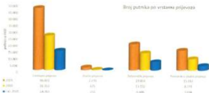
Grafikon 1. Prevezeni putnici po vrstama prijevoza