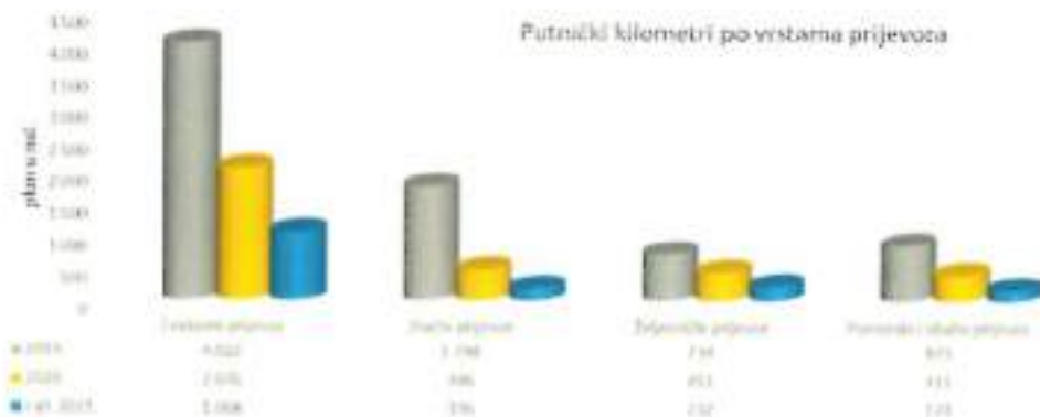
Grafikon 2. Ostvareni PKM-i po vrstama prijevoza