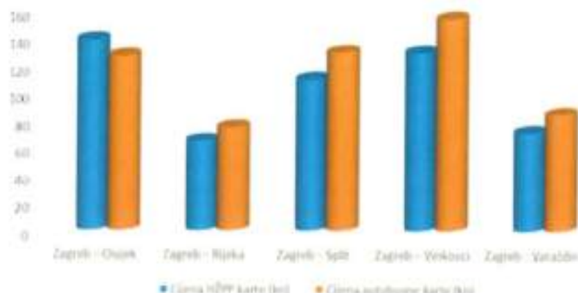
Tablica 3. Cijene karata po pojedinim relacijama za vlak i autobus

Napomena: prema Rijeci i Splitu primjenjuju se akcijske snižene cijene. Tako cijena prijevoza vlakom na relaciji Zagreb–Rijeka tijekom cijele godine iznosi 65 kn, a na relaciji Zagreb–Split 110 kn, odnosno tijekom ljetne sezone 120 kn.